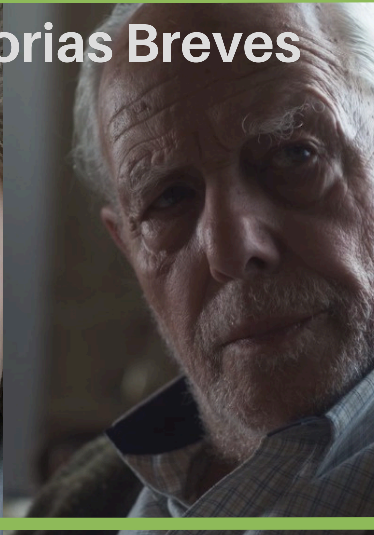
Asterion Dir: Eduardo Álvarez