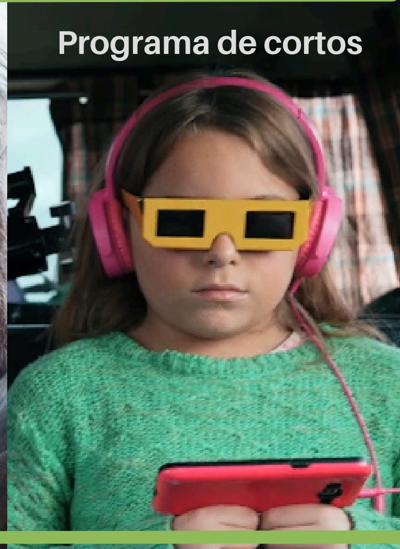
Un zorro Dir: Gastón del Porto