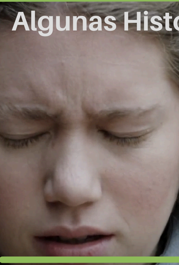
Una edad difícil Dir: Hugo Crexell